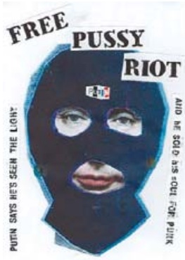
Рис. 3. Постер «Free Pussy Riot», Джеймі Рід, 2012 р.

на зміну поглядів суспільства, що викликана соціально-політичними тенденціями. Можна зазначити, що ідеологія панку, виникнення якої зумовлено обуренням і невдоволенням соціальним устроєм, знайшла своє відображення в графічному дизайні того часу, започаткувавши шокуючий, епатажний напрям, який руйнував усталені канони та слугував інструментом протесту. Вказані приклади мали суттєвий вплив на розвиток форм радикального дизайну наступних десятиліть і продовжують бути актуальними для сучасної графічної мови.