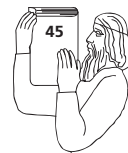
Алгоритм додрукарської підготовки журнального видання