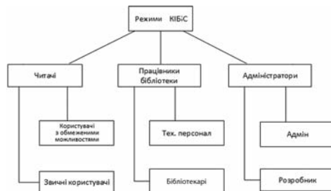
Ієрархія режимів кінцевого терміналу комп'ютеризованої інформаційної бібліотечної системи

тизованого інтерфейсу (рис.) з урахуванням особливостей функціонування програмного коду ядра проекту. Наступним етапом розгортання комп'ютеризованої інформаційної бібліотечної системи академічної установи є виявлення взаємозв'язків ядра з графічним інтерфейсом кінцевого терміналу та побудова відповідної структурної схеми.